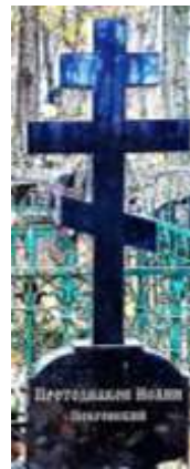
протоиерей Иоанн Покровский