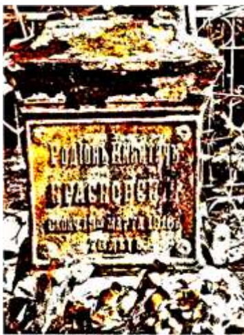
Мемориальная доска на памятнике Р. Н. Красновскому.