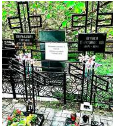
игумен Варсонофий (Верёвкин)