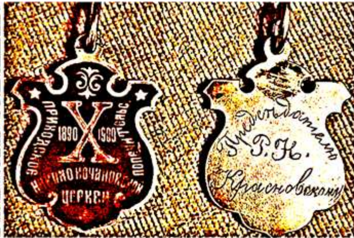
Знак, посвященный 10-летию приходского Николо-Качановского попечительства. Из собрания Красновских