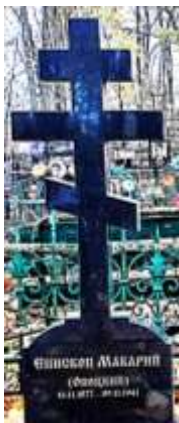
епископ Макарий (Опоцкий)