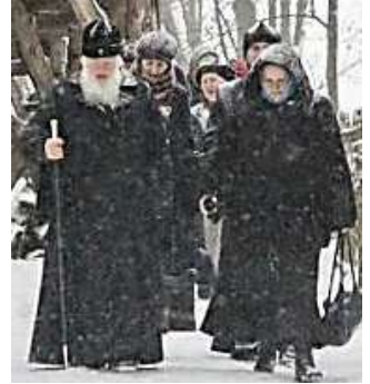
29 ноября 2012 года, в день 140-летия со дня рождения епископа Череповецкого Макария (Опоцкого), Митрополит Новгородский и Старорусский Лев совершил заупокойную литию по приснопамятным епископу Макарию, протоиерею Иоанну Покровскому и игумену Варсонофию (Веревкину)