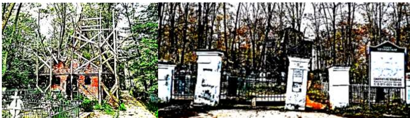
Вход на Петровское кладбище фото начала XXв..

Память ее верующие чтут в этот день поныне, обходя с молитвами церковь святых апостолов Петра и Павла на Синичьей горе, которая хранит святые мощи литовской княжны.