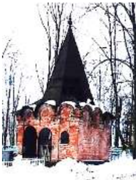
2009г. памятник-склеп известной в городе семьи Берго