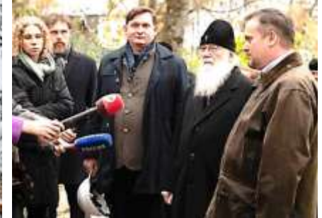
В ходе археологических работ в церкви апостолов Петра и Павла на Петровском кладбище Великого Новгорода обретыены мощи преподобной Харитины, княгини Литовской. Мощи были найдены у северо-западной стены внутри храма.