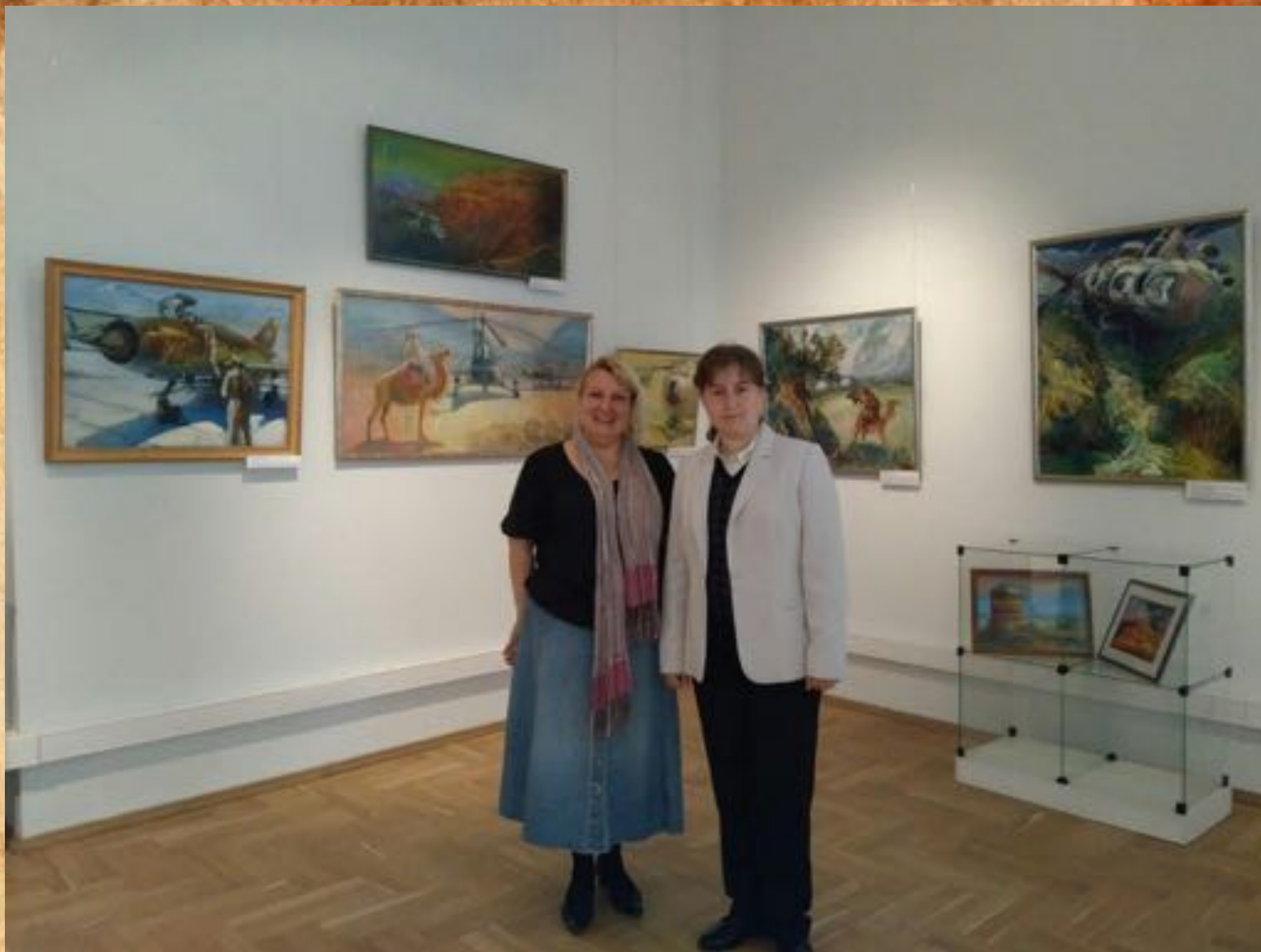
Посещение выставки художника Сергея Опульса «Перевал». Государственный мемориальный музей А.В. Суворова. 7 сентября 2017 г.