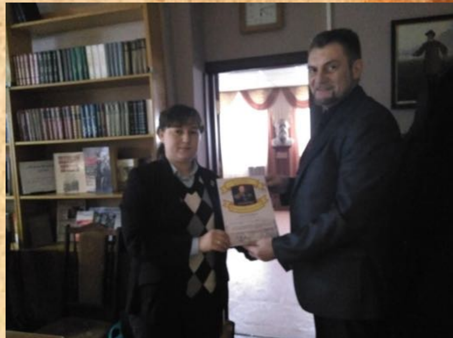
Рабочее совещание оргкомитета по подготовке фестиваля "Памяти предков - будем достойны" в Сиверском городском поселении. 4 марта 2017 г.