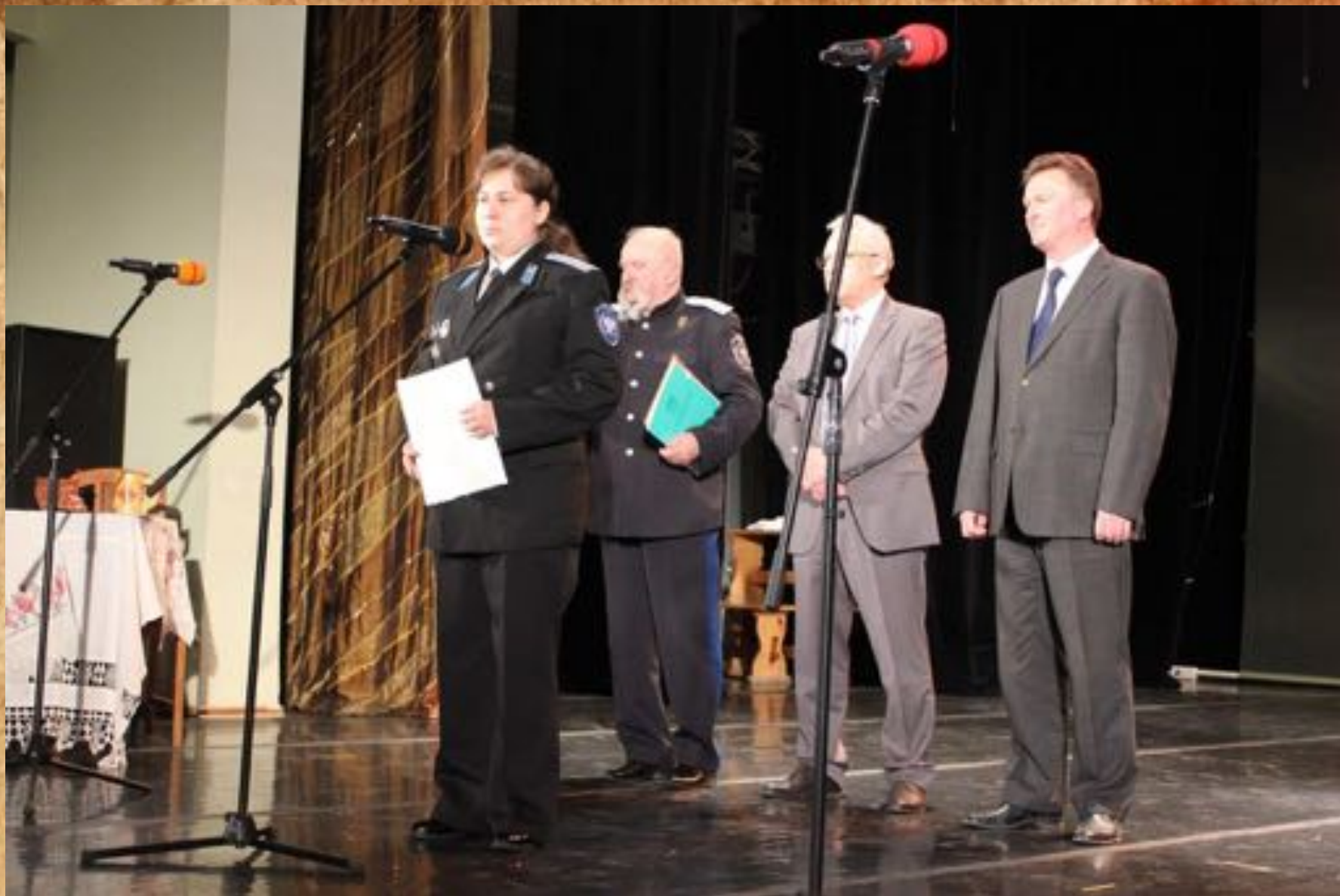
Поздравление казачьего ансамбля "Живая старина" с 10-летним юбилеем. КДЦ «Московский». 16 мая 2017 г.