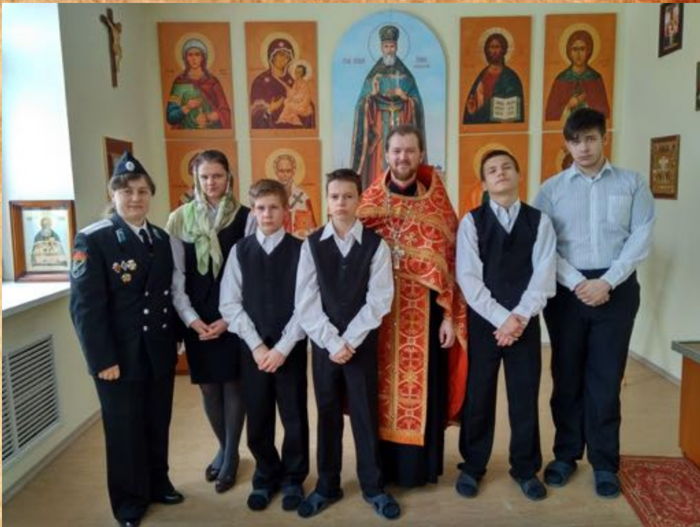
Организация пасхального молебна в ЦВСНП ГУ МВД России по г. Санкт-Петербургу и Ленинградской области в часовне во имя Святого Праведного Иоанна Кронштадтского. 17 апреля 2017 г.