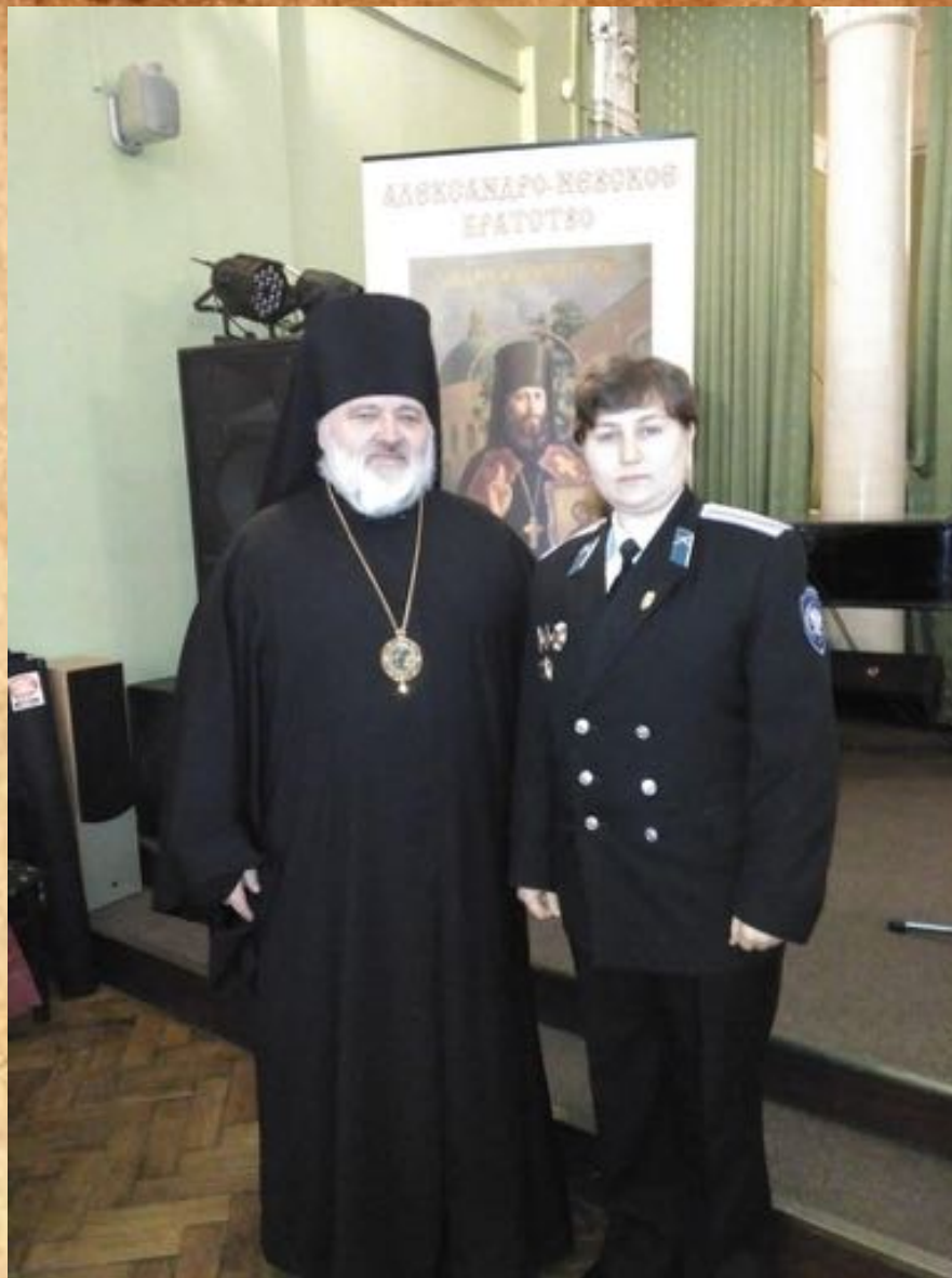
Вступление в Александро-Невское братство. С наместником Свято-Троицкой Александро-Невской Лавры, епископом Кронштадтским Назарием. 18 февраля 2017 г.