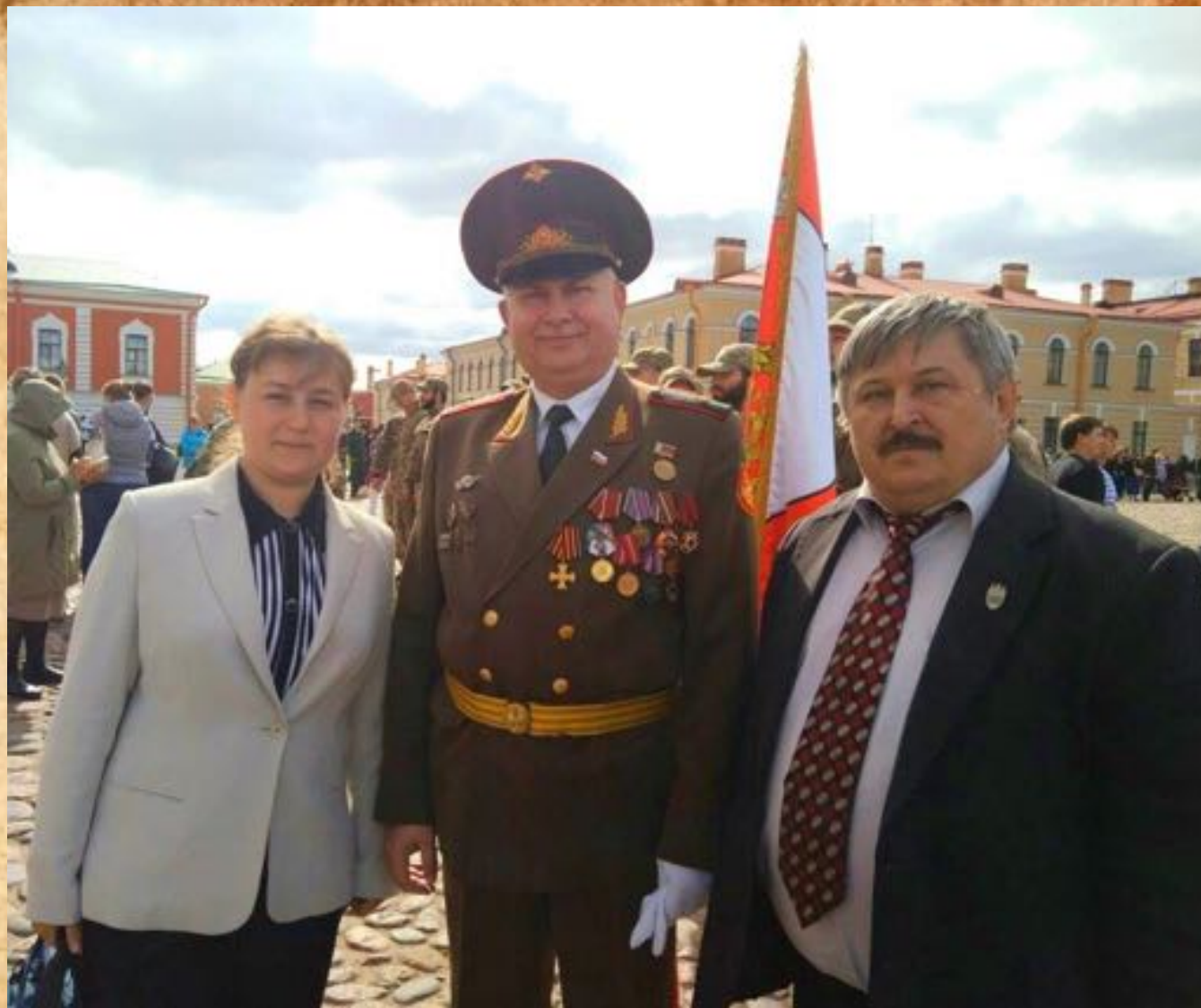
Участие членов братства в празднике «День российской Гвардии». Петропавловская крепость. 2 сентября 2017 г.