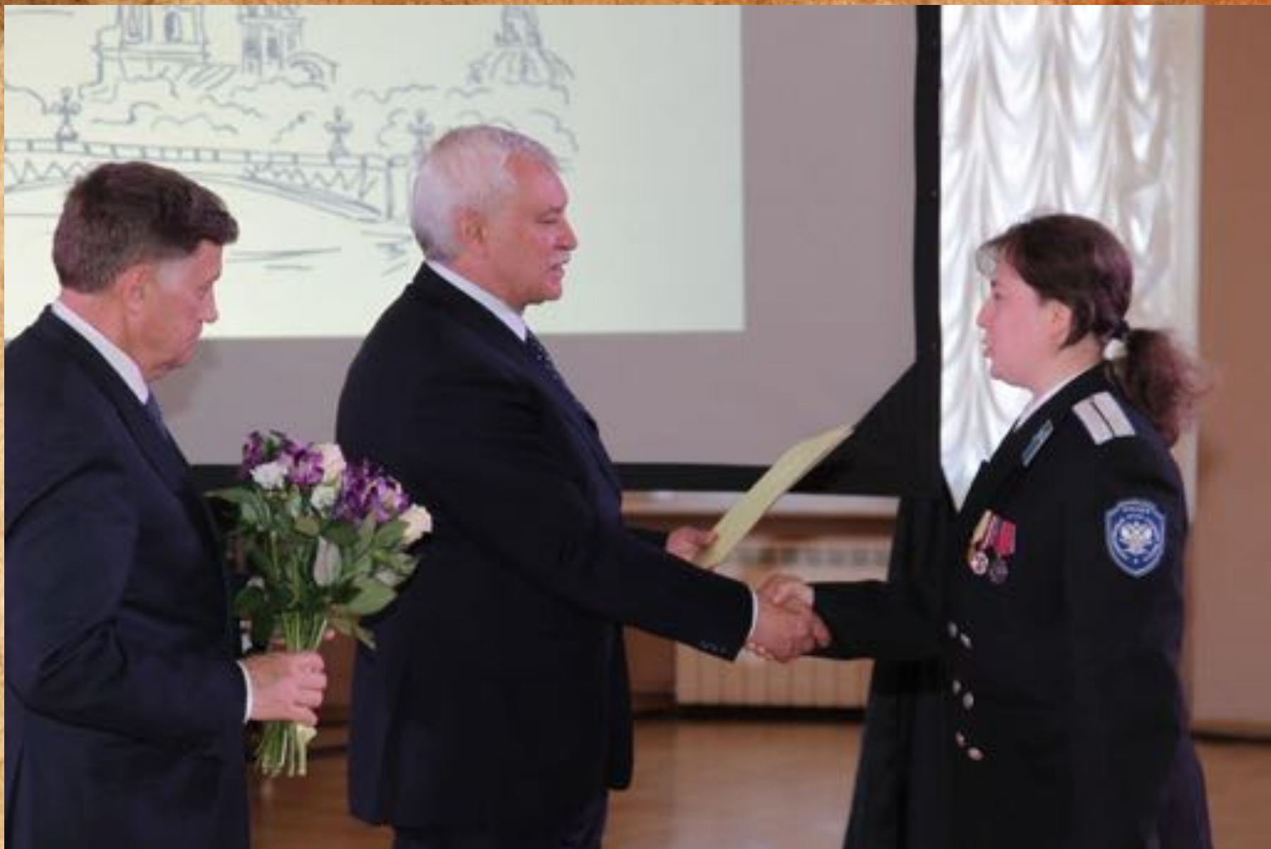
Награждение грамотой Губернатора Санкт-Петербурга Г.С. Полтавченко за активную патриотическую и духовно-нравственную деятельность. Таврический дворец. 15 июня 2017 г.