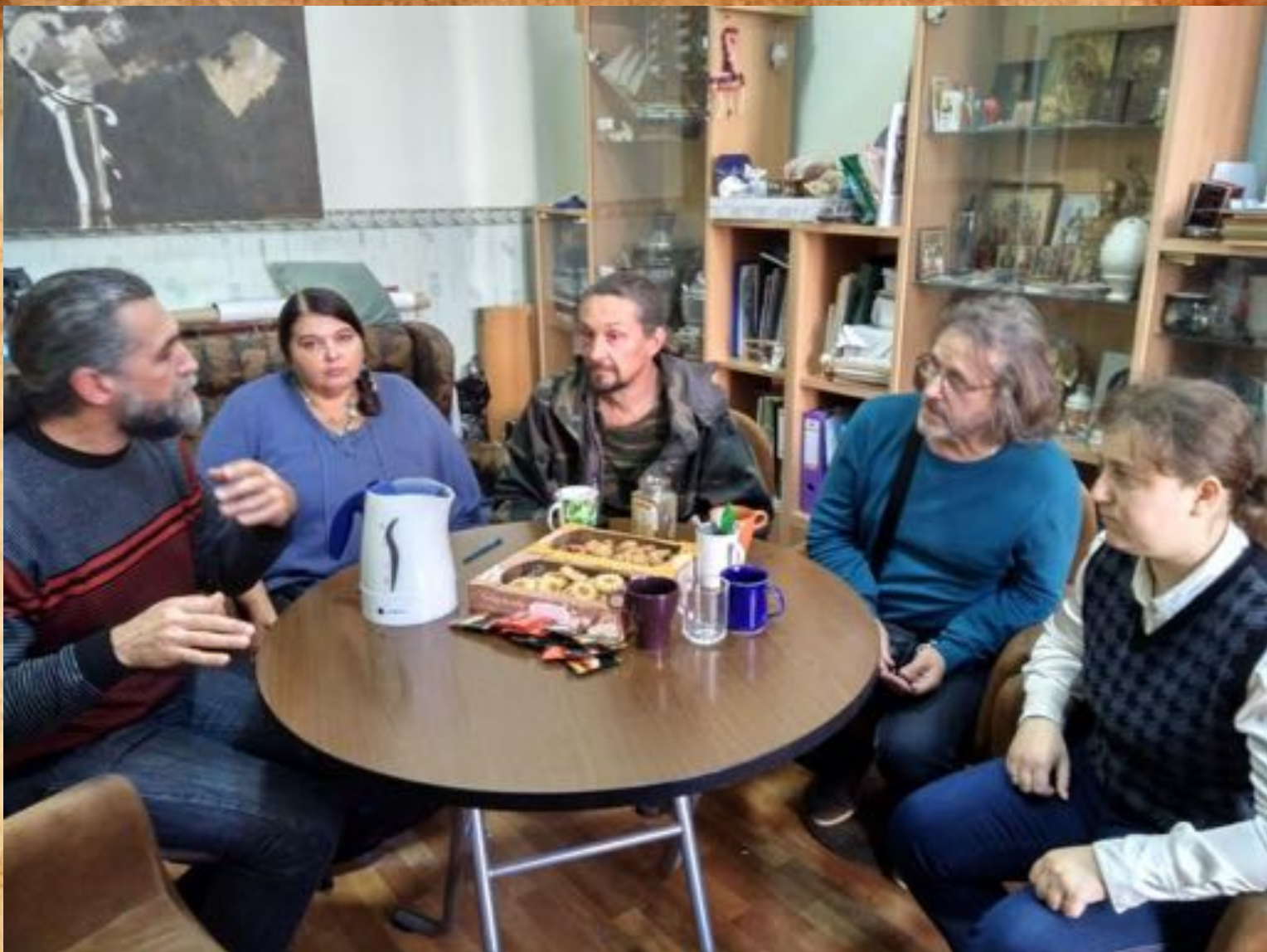
23 сентября 2017 г. в Святодуховском центре Александро-Невской Лавры на заседании оргкомитета фестиваля "Герои нашего времени (Сыны Отечества)".