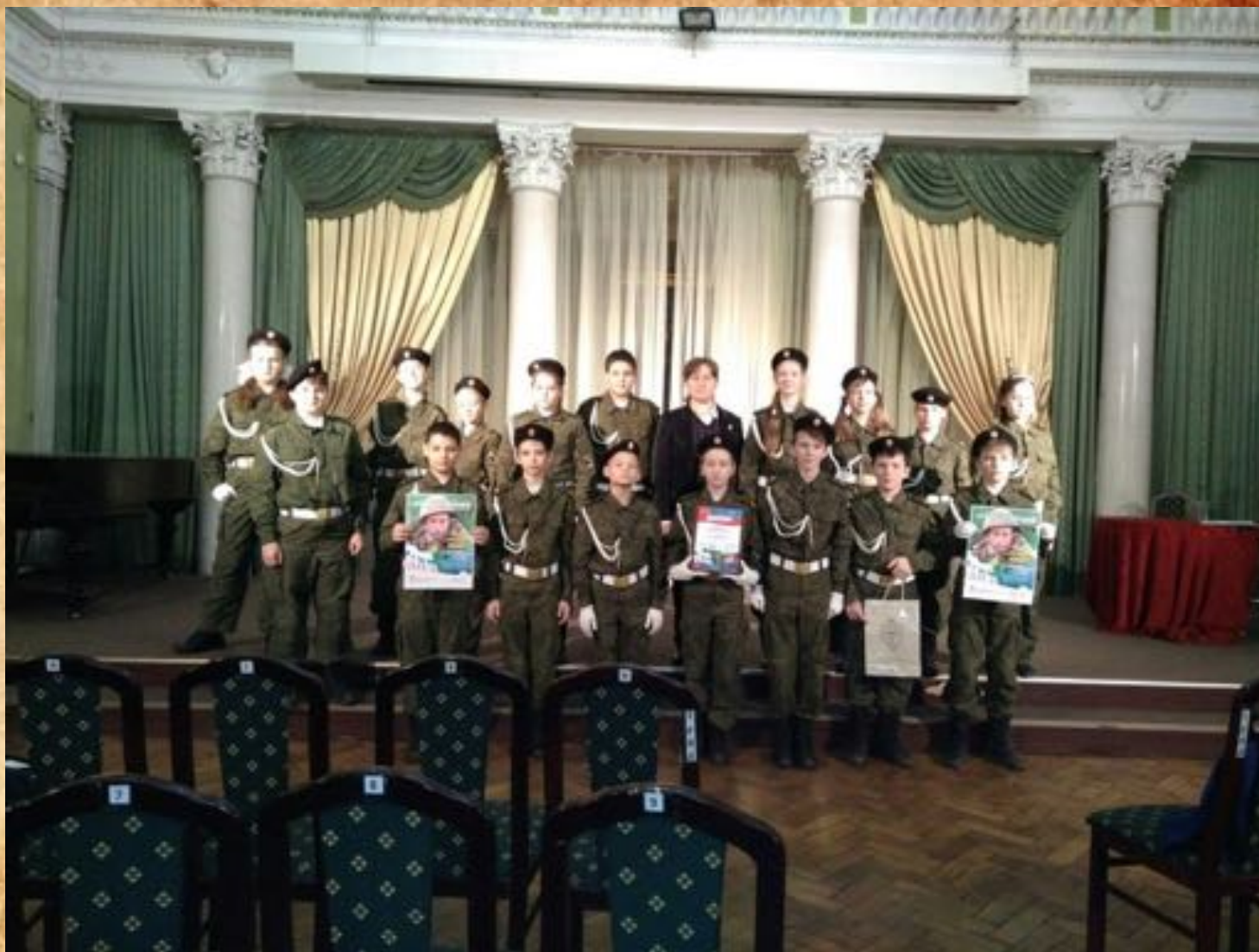
29 ноября 2017 г. в Святодуховском центре Александро-Невской Лавры на гала-концерте фестиваля «Герои нашего времени».