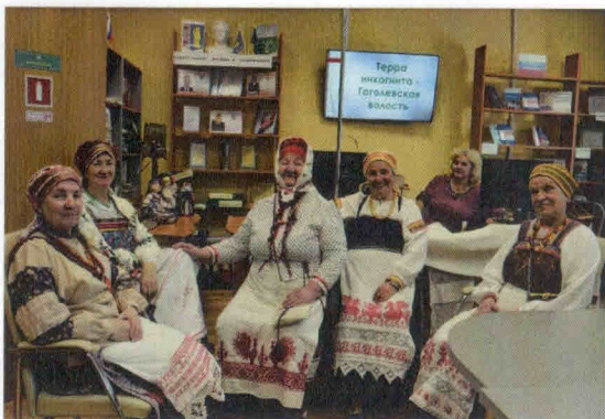
В Сланцевской центральной библиотеке